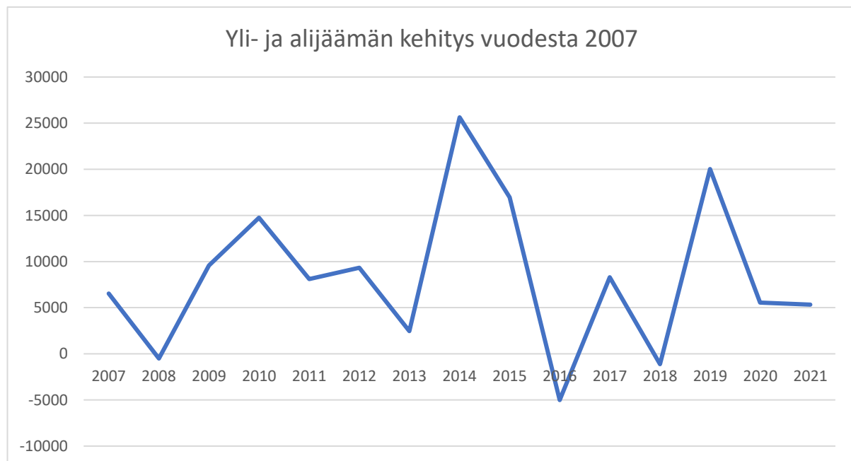
Kaavio 1. JAPA ry:n yli- ja alijäämän kehitys vuosina 2007-2021.

Yhdistys on hakenut verottajalta verohuojennusta maaliskuussa 2021.