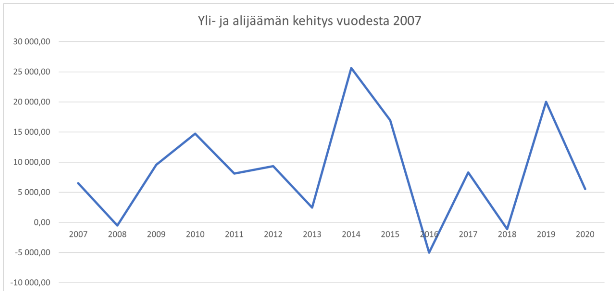
Kaavio 1. JAPA ry: yli- ja alijäämän kehitys vuodesta 2007.

JAPA ry:n tuotot olivat yhteensä 178 848,87 euroa ja tuloslaskelma 1.1.-31.12.2020 osoittaa 5 552,64 euron ylijäämää. Taseen loppusumma 31.12.2020 oli 143 230,93 euroa. Toimintavuoden tuloslaskelma ja tase ovat liitteenä ja kehitys vuodesta 2007 esitetty kaavioissa 1 ja 2.